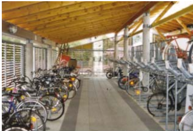
Cycle station, Bremen-Vegesack

lx-xogħol ta' żvilupp għal stazzjon ġdid għar-roti fl-istazzjon ċentrali tal-ferrovija fi Bremen sar tul il-proġett Target 1. L-istazzjoni għar-roti issa nbena u jesa' 1500 rota. Dan mhux biss joffri hażna sigura għal roti iżda wkoll servis, servizzi ta' tindif u kiri ta' roti. Karatteristika innovattiva oħra hija magna għat-tindif taż-żraben għal impjegati fl-uffiċċji. Hemm ukoll informazzjoni aċċessibbli