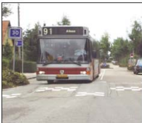
Public transport improvements, Odense

F'Odense l-patrunaġġ tat-trasport pubbliku kien ilu nieżel tul perjodu twil li tulu l-passiġġieri marru għal mezz oħra ta' transport, fosthom ir-rotta. Għalkemm ikkunsidrat minn perspettiva ta' politika ċiklistika, l-effett fit-tul kien deterjorament fil-kwalità tat-trasport pubbliku. Dan ġara minħabba n-nuqqas ta' vijabilità ekonomika ta' servizzi li ġab miegħu nuqqas ta' investiment fix-xarabanks li wassal għal flotta qed tixjieħ u dipendenza ridotta. Biex tagħqad, l-għoti ta' informazzjoni kien dgħajef u l-velocità tax-xarabanks saħanistra lanqas kienet tajba biex tikkompeti mar-rotti. B'appoġġ minn Target 2 kienet żviluppata strategija biex tindirizza l-