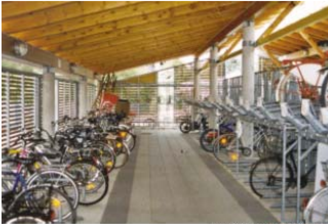
Cycle station, Bremen-Vegesack

Το αναπτυξιακό έργο για το νέο σταθμό ποδηλάτων στον κεντρικό σιδηροδρομικό σταθμό στην πόλη Bremen έγινε κατά τη διάρκεια του έργου Στόχος 1. Ο ποδηλατικός σταθμός έχει τώρα αποπερατωθεί με δυνατότητα εξυπηρέτησης 1500 ποδηλάτων. Πέραν από ασφαλή αποθήκευση για τα ποδήλατα, στο σταθμό μπορεί κάποιος να ενοικιάσει ποδήλατα, ενώ προσφέρονται και υπηρεσίες συντήρησης και