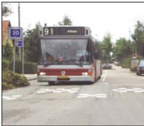
Public transport improvements, Odense

Στην Odense η χρήση των δημόσιων μεταφορών ακολουθούσε μια πτωτική πορεία για ένα μεγάλο χρονικό διάστημα καθώς οι ταξιδιώτες χρησιμοποιούσαν άλλες μορφές μετακίνησης συμπεριλαμβανομένου του ποδηλάτου. Από τη πλευρά της πολιτικής για την προώθηση της ποδηλασίας αυτή η εξέλιξη ήταν θετική, αλλά το μακροχρόνιο αποτέλεσμα ήταν υποβάθμιση της ποιότητας των δημόσιων μεταφορών. Αυτό ήταν αποτέλεσμα της μη οικονομικής βιωσιμότητας των υπηρεσιών και της